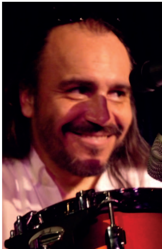
Minino Garay © DR