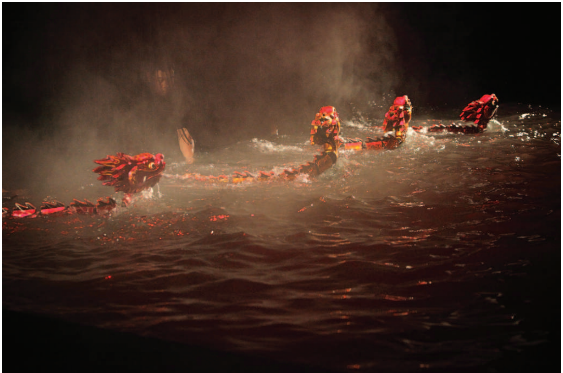
Le Maître des marionnettes. Du 10 au 25 février 2012

Autour du spectacle des ateliers, contes et rencontres avec les créateurs de ces silhouettes traditionnelles sont proposés aux familles et jeunes visiteurs, pour découvrir d'autres formes de marionnettes en provenance de différents horizons techniques et artistiques.