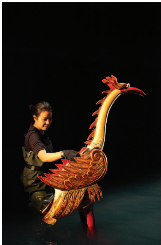
Le Maître des marionnettes. Du 10 au 25 février 2012