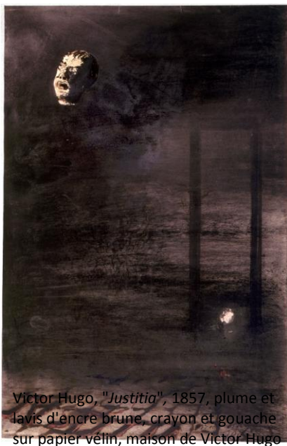
Victor Hugo, "Justitia", 1857, plume et lavis d'encre brune, crayon et gouache sur papier vélin, maison de Victor Hugo

« Un matin je me suis dit : je ferai trois romans sur les numéros des trois premiers cabriolets que je rencontrerai aujourd'hui. J'ai rencontré les numéros 1699, 1792 et 1482. C'est pourquoi j'ai fait Han d'Islande , Bug-Jargal et Victor Hugo, Notre-Dame de Paris . » Portefeuille, feuilles paginées II, 1830-1833