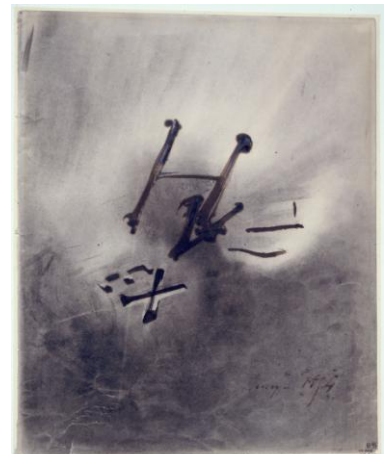
Victor Hugo, "Exil (ou initiales)", 1855, Maison de Victor Hugo

En écrivant dans sa préface aux Contemplations : « Ah ! insensé qui crois que je ne suis pas toi ! », Victor Hugo donne la clé de son combat pour la liberté, qui ne ressemble à aucun autre. C'est la conscience de participer de cette nuit commune, qui l'aura peu à peu conduit, en dehors de quelque idéologie que ce soit, à être de toutes les luttes contre ce qui amoindrit, avilit ou tue, quel qu'en soit le prix. Ainsi le jeune royaliste