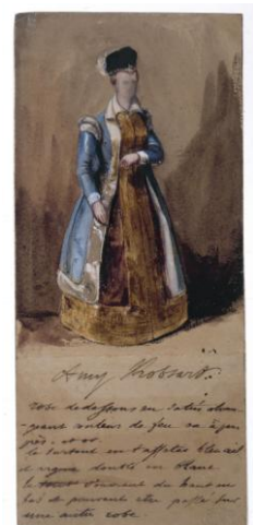
Eugène Delacroix, Costume d'Amy Robsart , vers 1828, Maison de Victor Hugo

Dès l'enfance, Victor Hugo aura été fasciné par le théâtre. À seize ans, il en a fait le tour, ayant écrit, d'abord avec ses frères, puis seul, un mélodrame, une tragédie, un vaudeville-opéra-comique... et même un drame romantique. Mais c'est entre 1827 et 1843 (de Cromwell avec sa préface aux Burgraves en passant par Hernani en 1830 et Lucrece Borgia en 1833 à l'origine de sa rencontre avec Juliette Drouet) que le théâtre va devenir pour lui le lieu, où les plus grands enjeux — qu'il s'agisse du langage, de l'amour ou de la liberté — se rejoignent pour apparaître sur fond d'abîme. Tout semble, en effet, s'y jouer entre deux nuits, celle de la passion et celle de ce qui s'y oppose, déterminant une scène aussi vide et obscure que la chambre noire d'un système optique, où la lumière ne peut surgir que de l'intensité de leur affrontement. Tel est l'espace, tout à la fois réel et irréel, de ce théâtre des passions qui n'en finit pas d'outrepasser celui du théâtre proprement dit, pour approfondir la