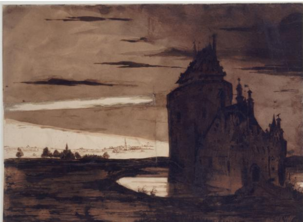
Victor Hugo, "Vieux burg dans l'orage", 25 août 1837, plume et lavis d'encre brune, papier vélin, Maison de Victor Hugo

À partir de sa rencontre avec Juliette Drouet, Victor Hugo va partir en voyage chaque année pour visiter la Bretagne en 1834, la Belgique en 1837, le Rhin en 1838 et 1840... On pourrait y voir le prolongement d'un goût de l'ailleurs, lié aux voyages de ses jeunes années, que sa mère entreprit pour rejoindre son père en Italie puis en Espagne. Mais si, de retour à Paris, l'enfant n'en rêva pas moins de voyager, l'adulte voyagea pour rêver.