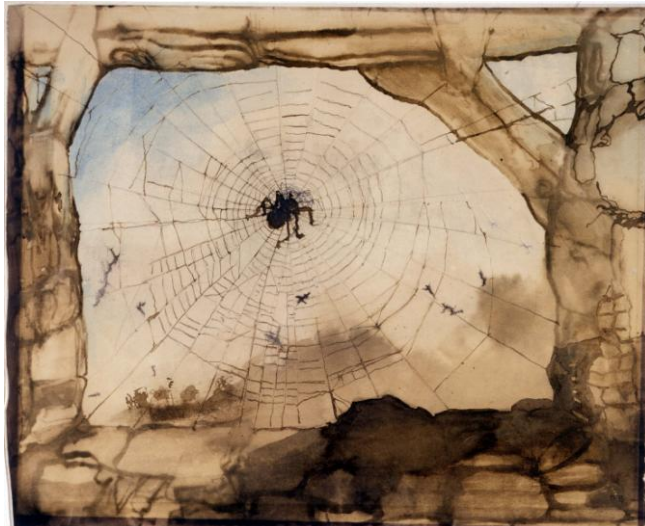
Victor Hugo, "Vianden à travers une toile d'araignée", 13 août 1871, dessin, plume et lavis d'encre brune et violette, crayon, aquarelle, Maison de Victor Hugo

Le parcours s'articule autour de 7 sections thématiques et chronologiques : noir comme la jeunesse : l'entrée dans l'obscurité intérieure avec premiers romans, Han d'Islande , Bug-Jargal , Notre-Dame de Paris ; noir comme le théâtre des passions : autour du théâtre comme système optique pour interroger les errements du cœur humain et de « la liberté d'aimer », avec Juliette Drouet ; noir comme les voyages : ceux des années 1840, où le paysage devient à la fois source et miroir de la rêverie ; noir comme la liberté : exil et attirance pour les marges sociales, littéraires et pour l'ailleurs... ; le choix du noir : l'affirmation du noir, avec l'aménagement d'Hauteville House conçu comme un théâtre mental ; noir comme l'infini : autour des Travailleurs de la mer et des forces obscures du monde ; enfin noir comme l'éblouissement : uniquement composée d'extraits de textes, cette section évoquera la puissance lyrique de Victor Hugo.