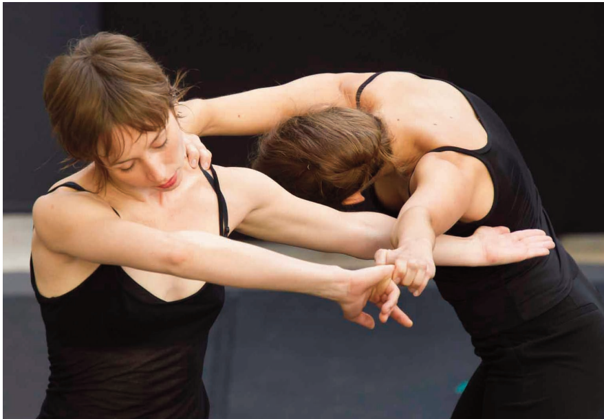
À la gauche de l'espace

Les mardis 8 novembre et 6 décembre 2011 Les mardis 10 janvier, 7 février, 6 mars et 3 avril 2012 à 19h